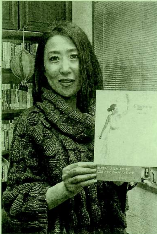
自身初のCDブックを発売したオノさん